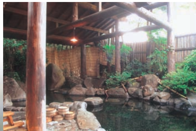
広々とした情緒ある男女別露天風呂