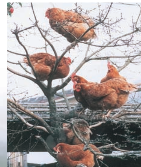
木の枝で寝る放し飼いのにわとり