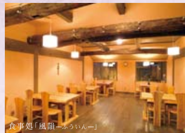
食事処「風韻—ふういん—」